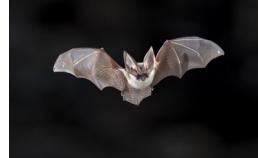
8. Fledermaus (Artangabe nicht erforderlich)

Die Karte kann auch in Bensheim in der Tourist-Info, im Bürgerbüro oder im Rathaus abgegeben werden